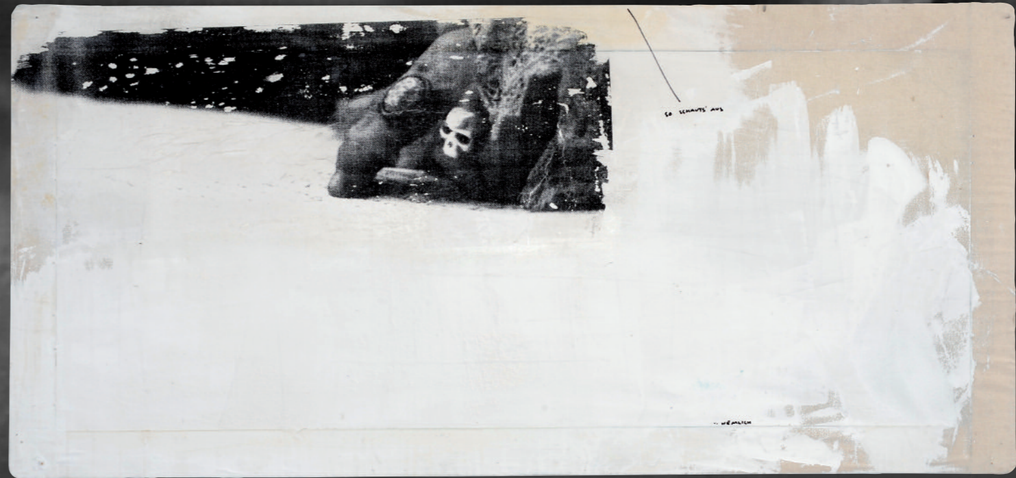
SO SCHAUTS AUS09-88X188