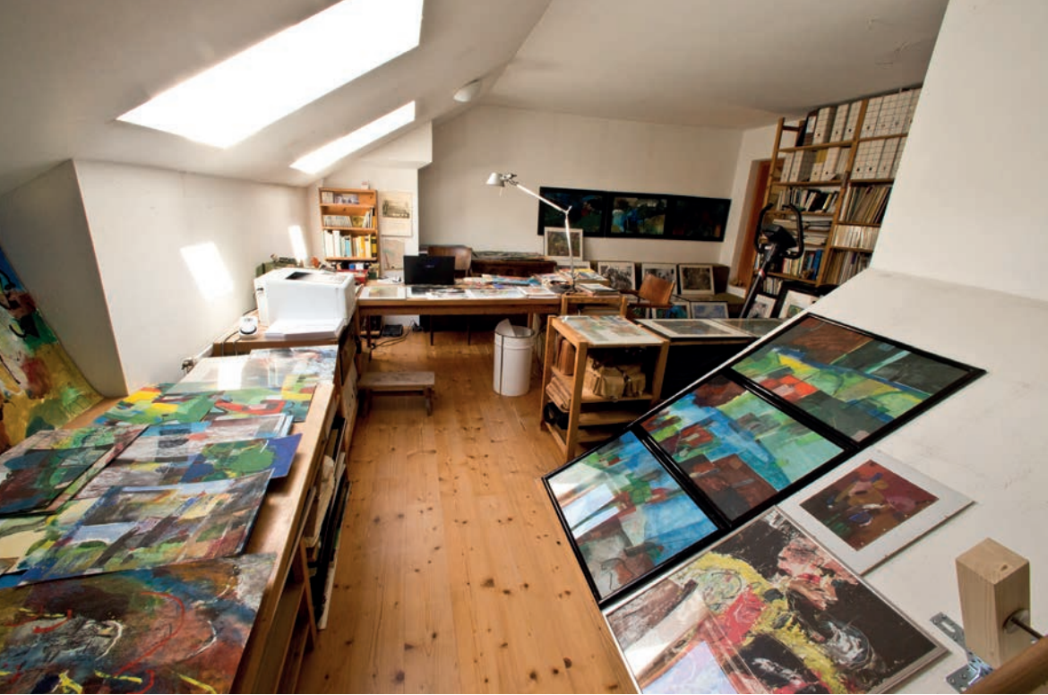
Blick ins Atelier (Graz; 2021)