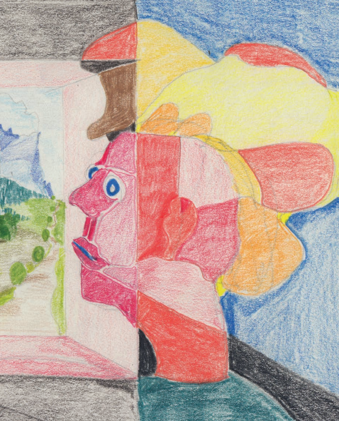
Abb. 49: Buntstift auf Papier; 18,5 x 30 cm