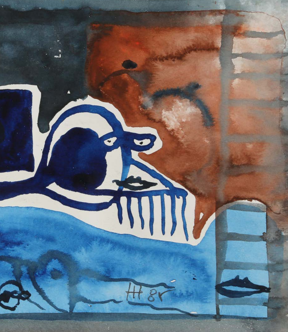
Abb. 9: Aquarell auf Papier; 14,5 x 24,5 cm (1985)