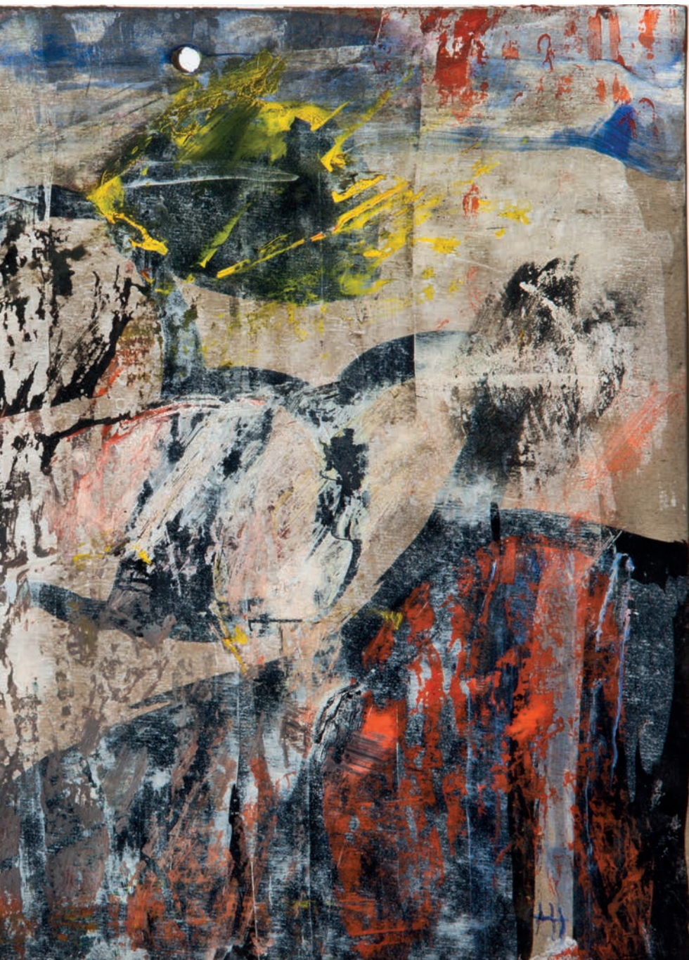
Abb. 80: Gouache, Wachskreide auf Papier; 21 x 29,7 cm