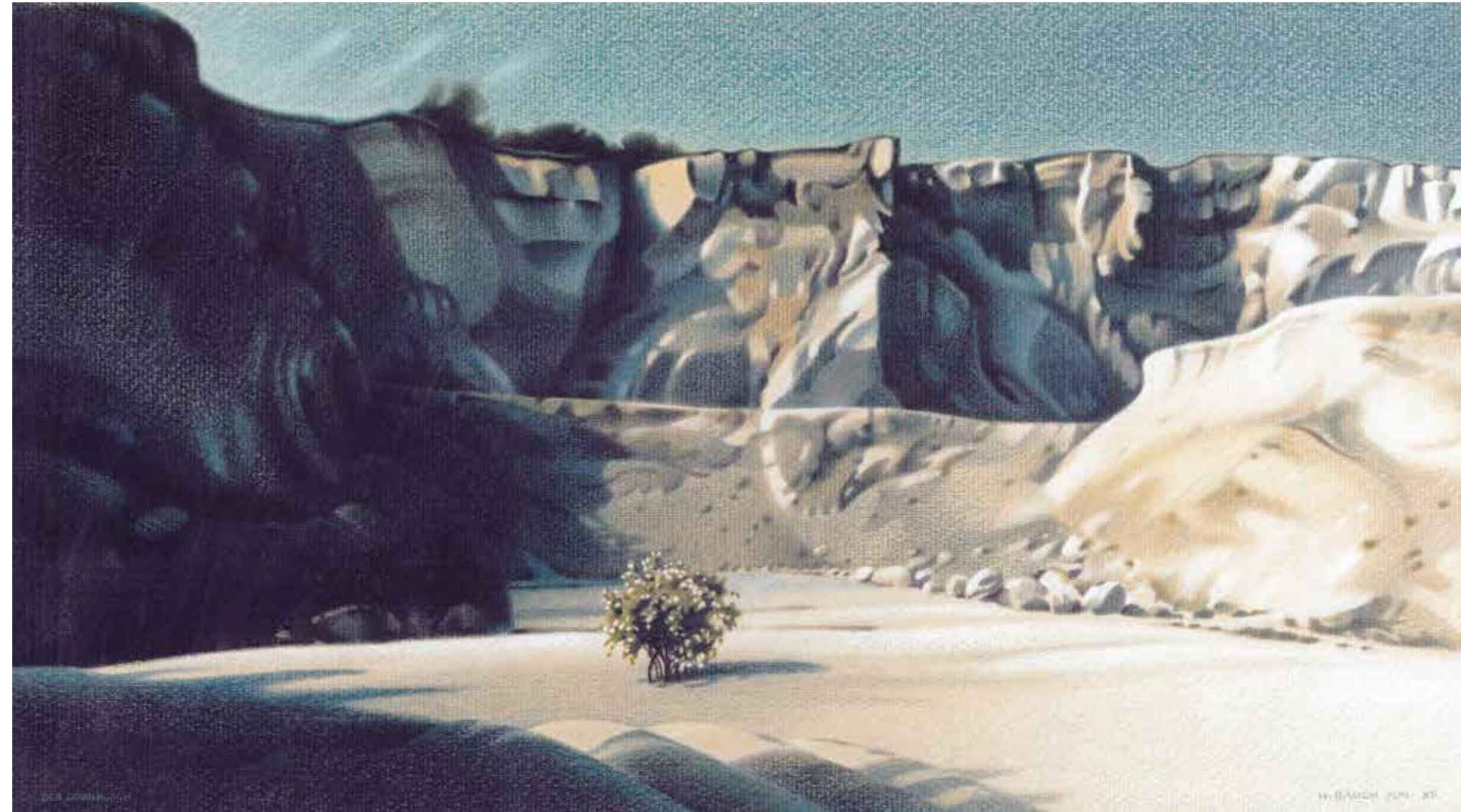
Der Dornbusch (Steinbruch Falkenstein) / 1985 / Buntstift auf Ingrespapier