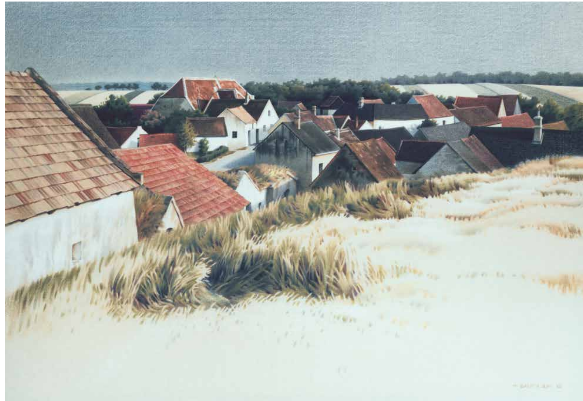
Dachlandschaft – Drasenhofen / 1992 / Buntstift auf Ingrespapier / 66 x 45 cm