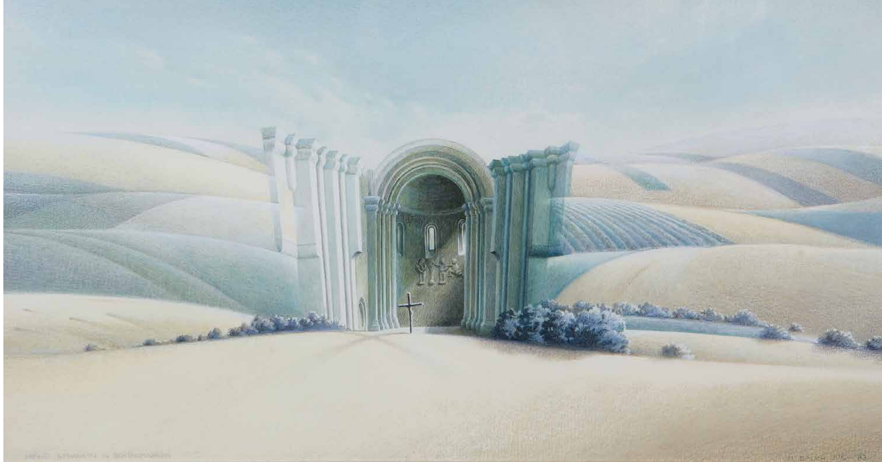
Meine Gedanken in Schöngabern / 1983 / Gouache

Peter Ebenberger, Meine Gedanken in Schöngabern