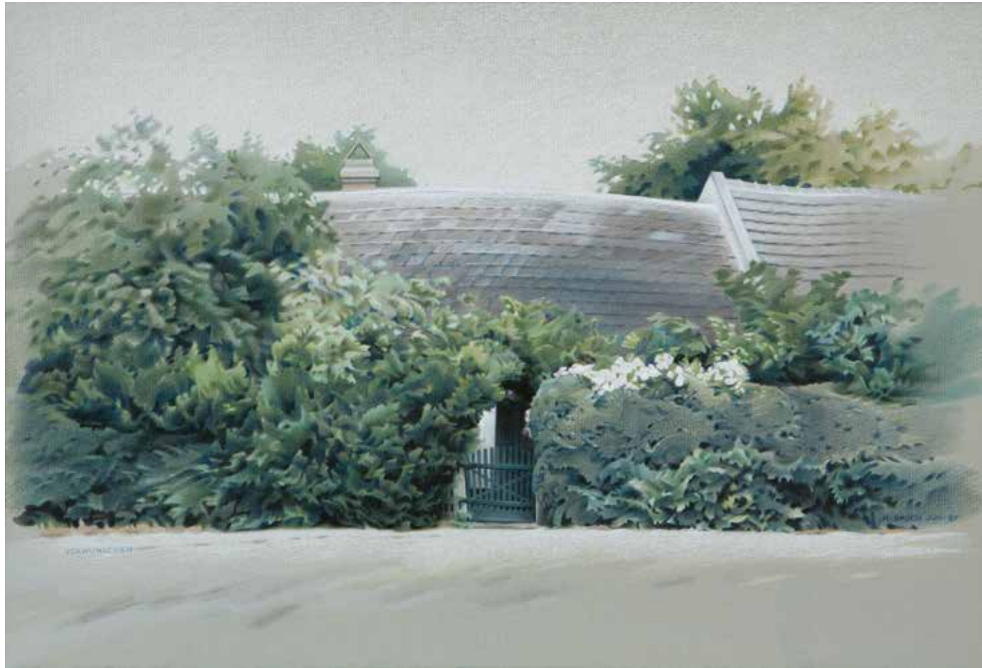
Verwunschen / 1987 / Buntstift auf Ingrespapier / 53 x 36 cm