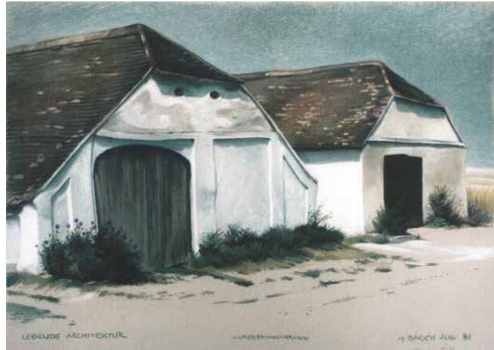
Lebende Architektur / 1981 / Ölkreide / 65 x 45 cm