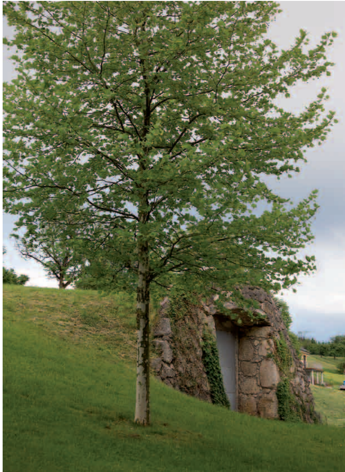
Der alte Märzenkeller von Schoss Eggenberg von 1850