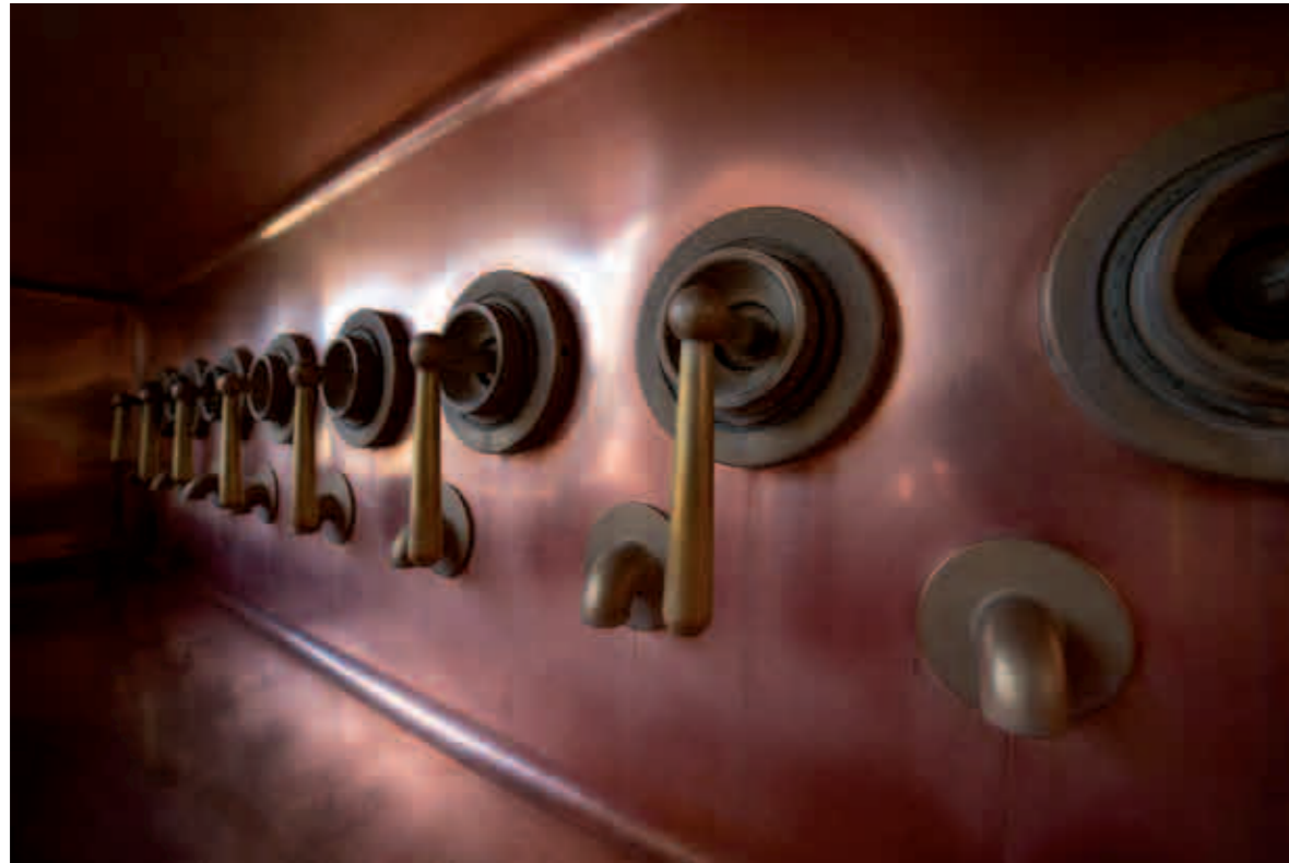
Das alte Läutergrander zum Abläutern der Würze aus dem Läuterbottich, 1980