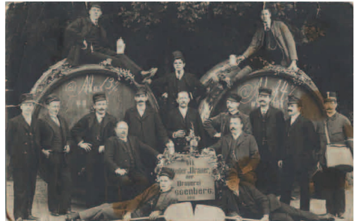
Die Brauer von Schloss Eggenberg, 1912