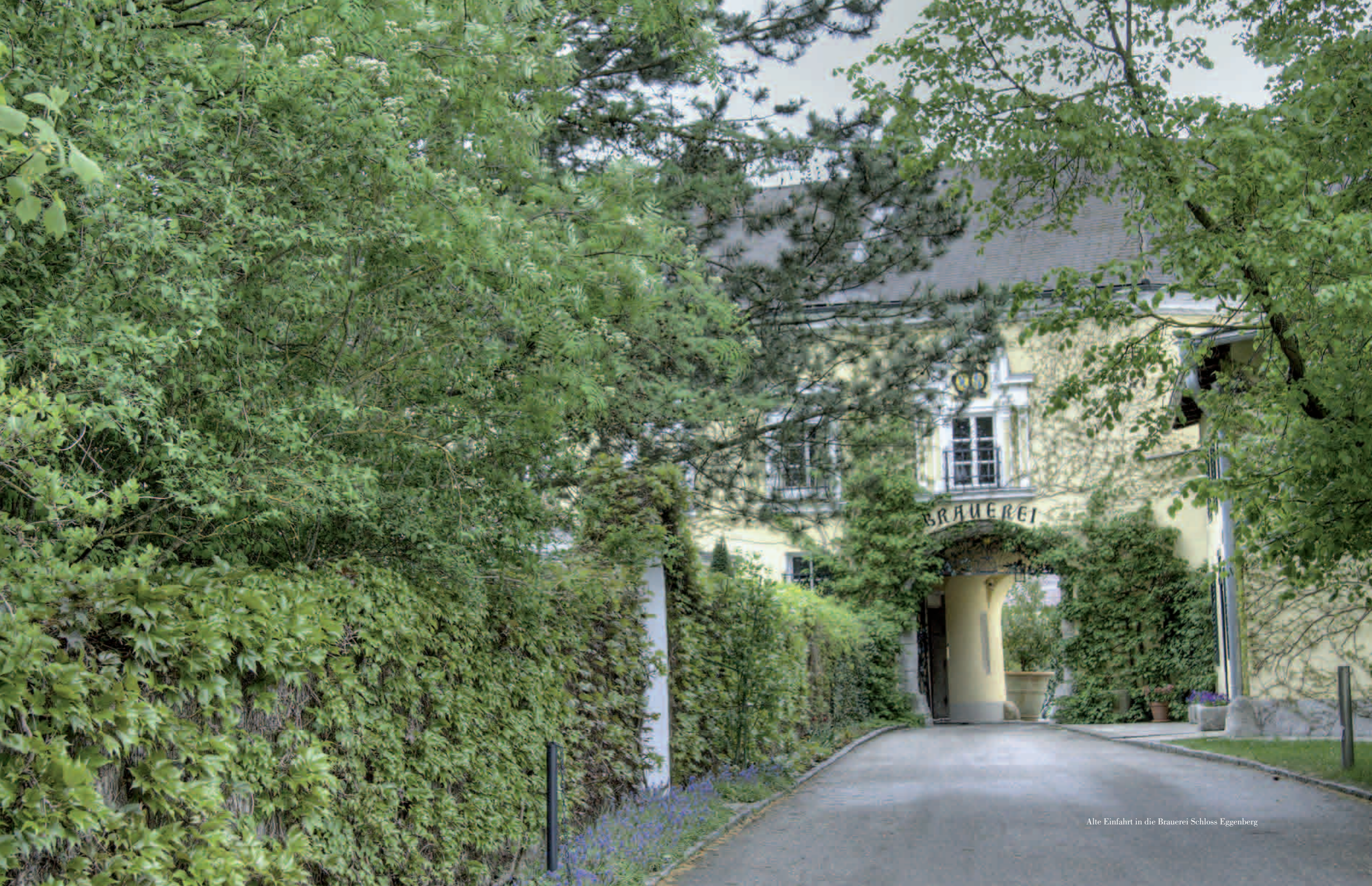
Alte Einfahrt in die Brauerei Schloss Eggenberg