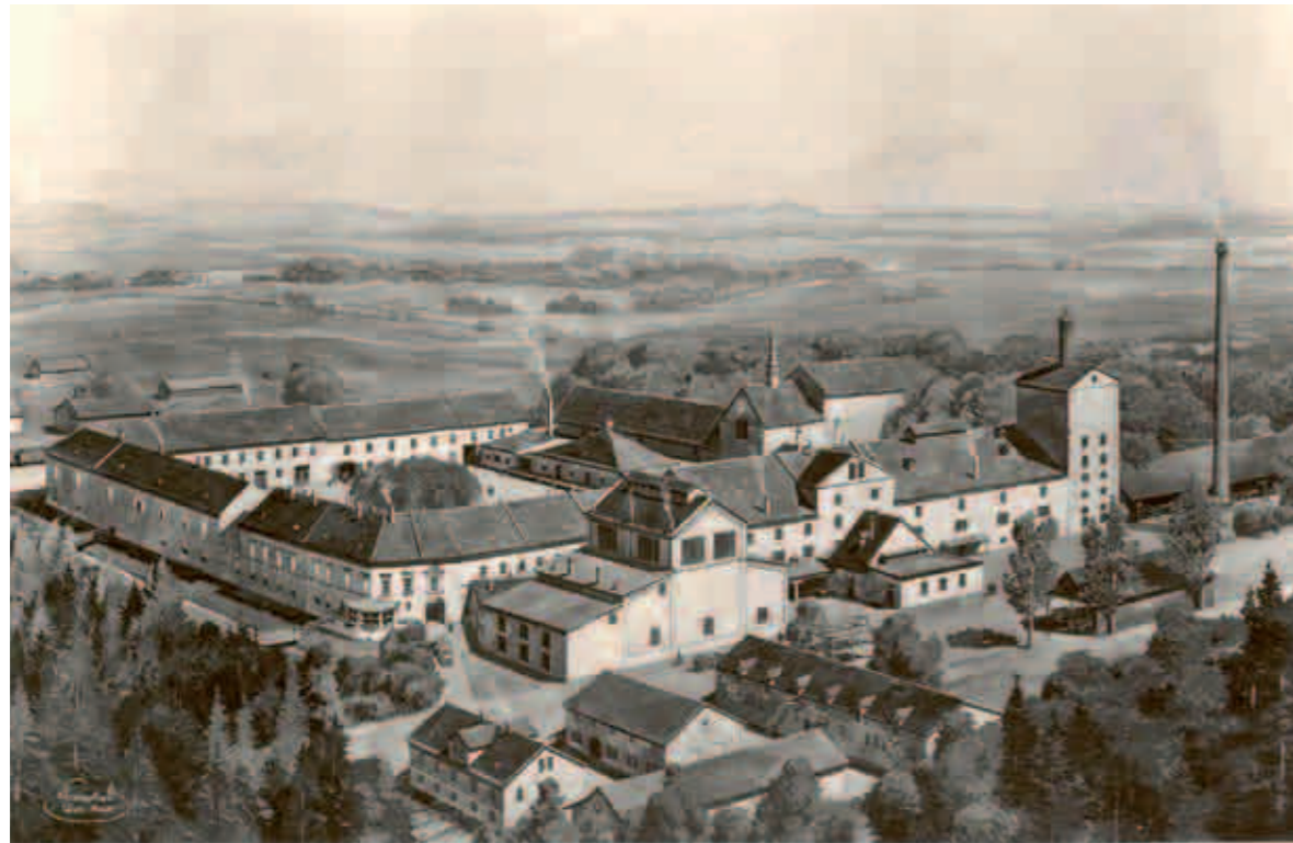
Brauerei Eggenberg, zu Beginn des 20. Jahrhunderts