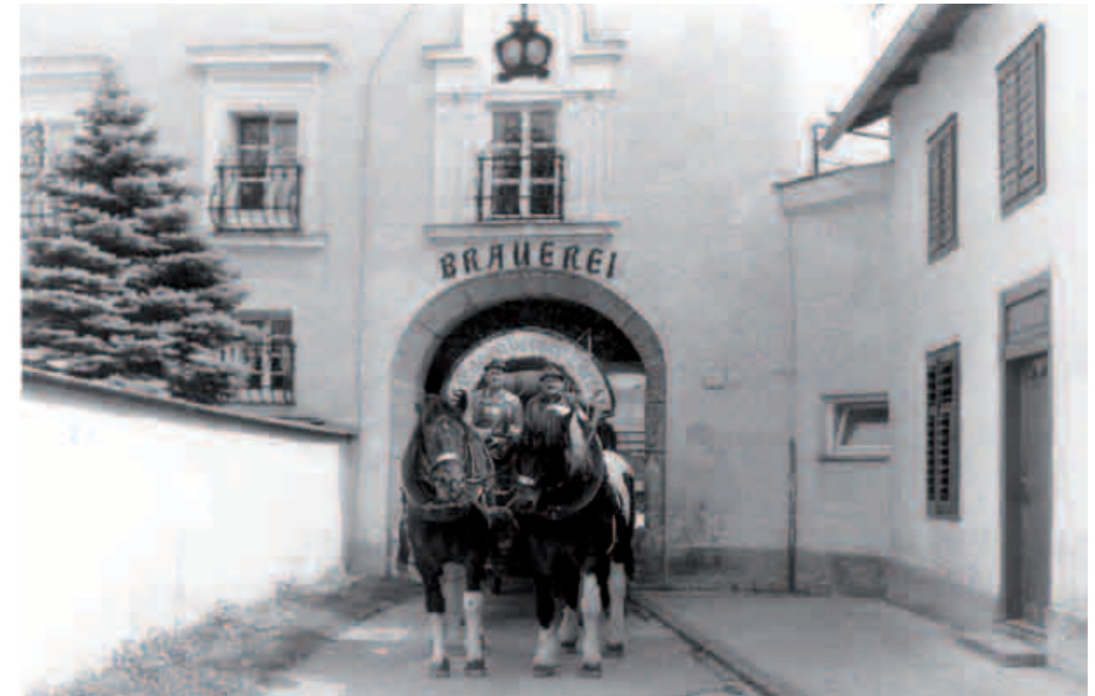
Die alte Einfahrt in die Brauerei