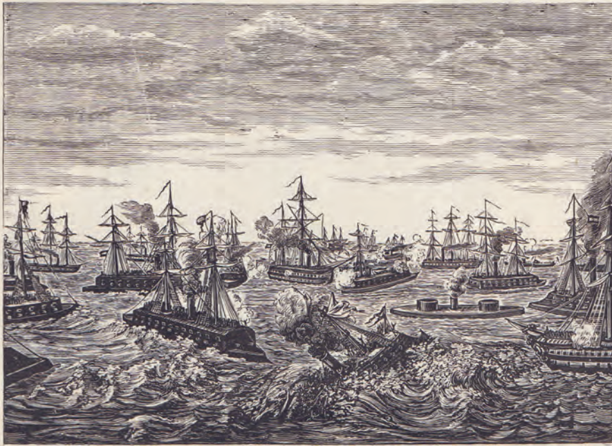
Viška bitka, gravura, prije 1882., © Arhiv Littrow u Beču

Opće oduševljenje pobjedom kod Visa austrijske mornarice pod admiralom Tegetthoffom zahvatilo je i Littrowa i gotovo ga primoralo na pisanje velike pjesme Matrosenlied. Den Siegern von Lissa gewidmet ( Pjesma mornara. Posvećeno pobjednicima kod Visa ) (Trst, 1866.).