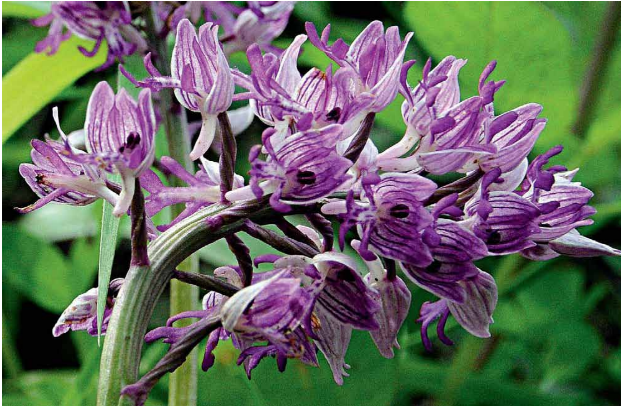
↑ 052 Helm-Knabenkraut ( Orchis militaris ).

The biological diversity of the Wachau is reflected in some thirty species of orchids.