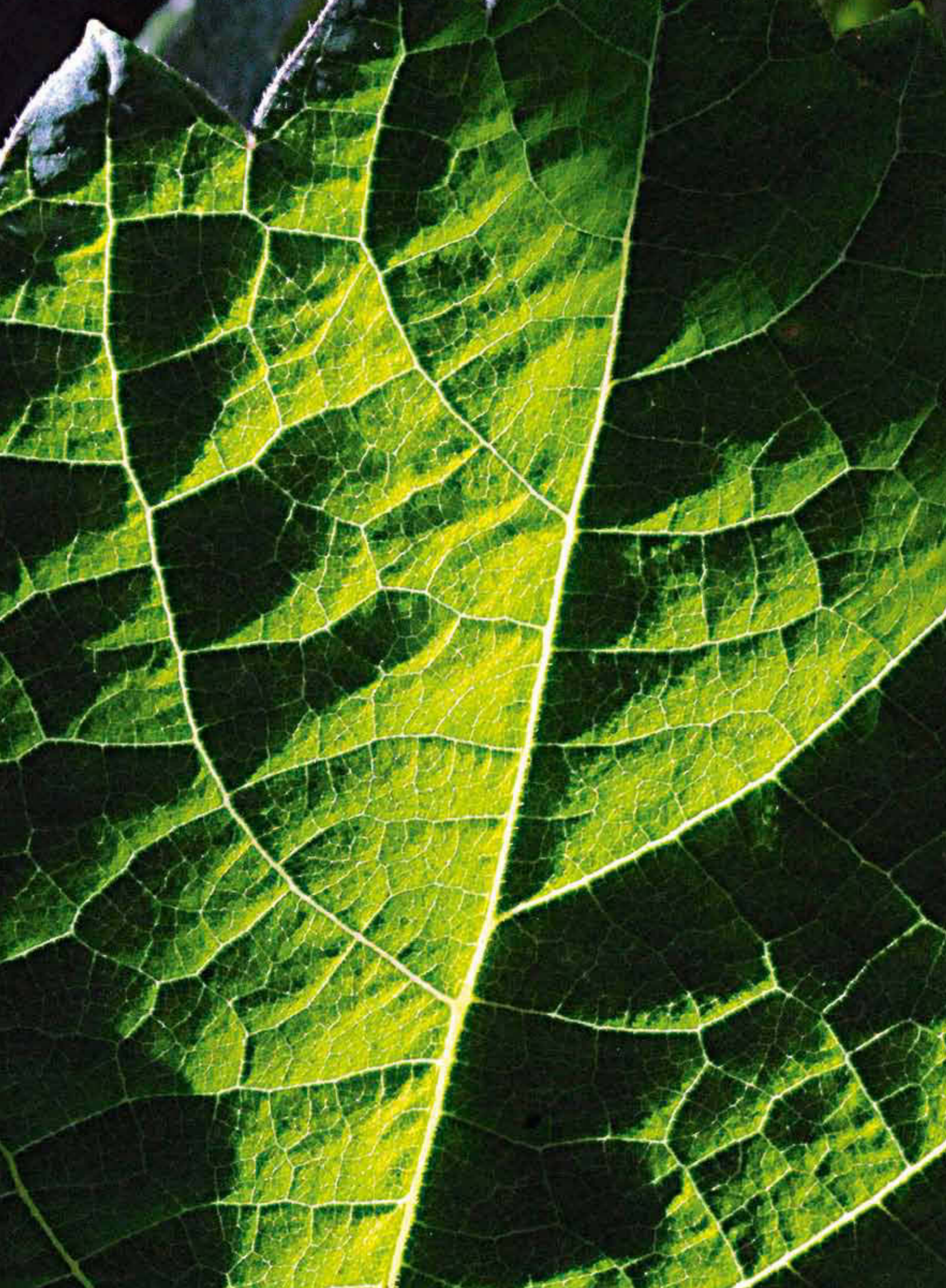
403 Struktur eines Weinblattes.