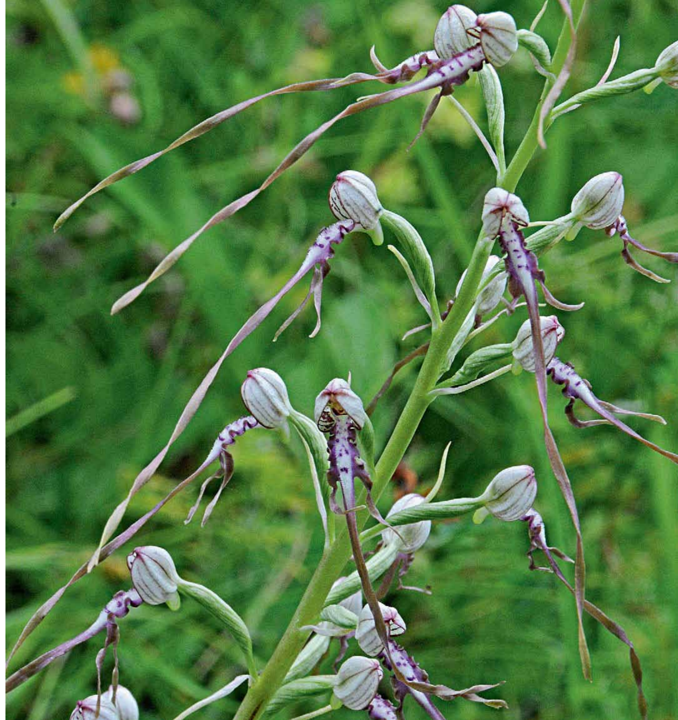
→ 053 Adriatische Riemenzunge ( Himantoglossum adriaticum ), eine der seltensten Orchideenarten Mitteleuropas.