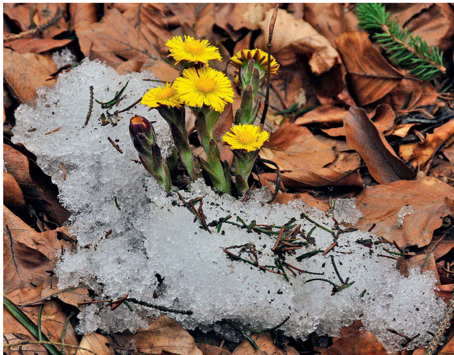
037 Winterende mit Huflattich ( Tussilago farfara ) zwischen Schneeresten.