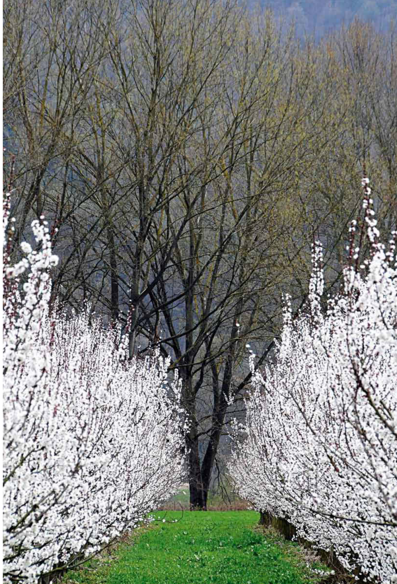
362 Marillenblüte in der Wachau.