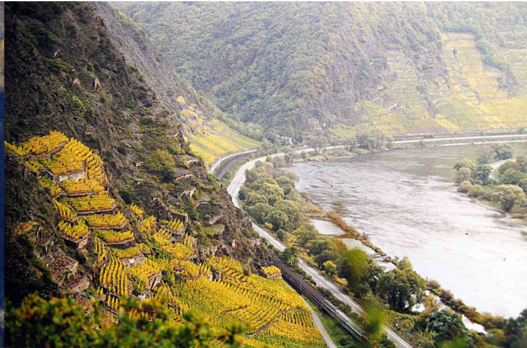
350 Der Calmont an der Mosel gilt als der steilste Weinberg Europas.

← 349 Spitzer Weinrieden: Mitte unten: Achspoint – Hochrain, rechts oben: Singerriedel, links oben: Pluris – Rotes Tor.