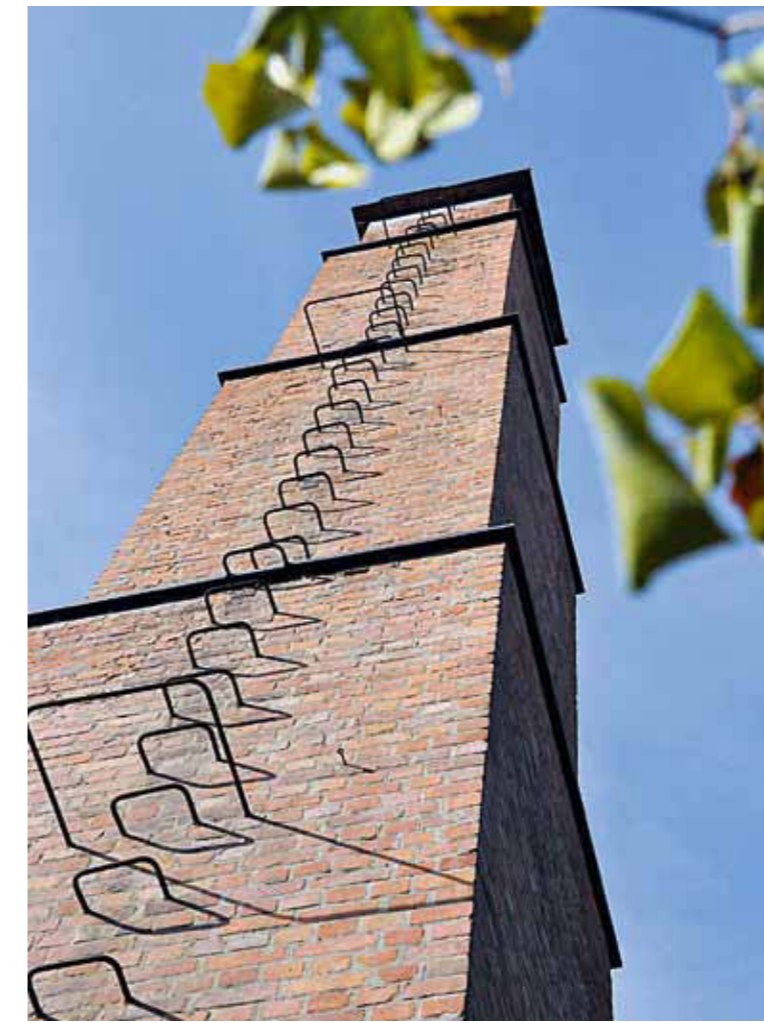
342 Schornstein des Krematoriums.

Während des Zweiten Weltkrieges errichteten KZ-Häftlinge bei Melk eine unterirdische Fabrikanlage; dabei kamen etwa 5.000 Menschen ums Leben (14.11). Das KZ Melk , eine Außenstelle von Mauthausen, ist heute ein Mahnmal an eine grauenvolle Zeit.