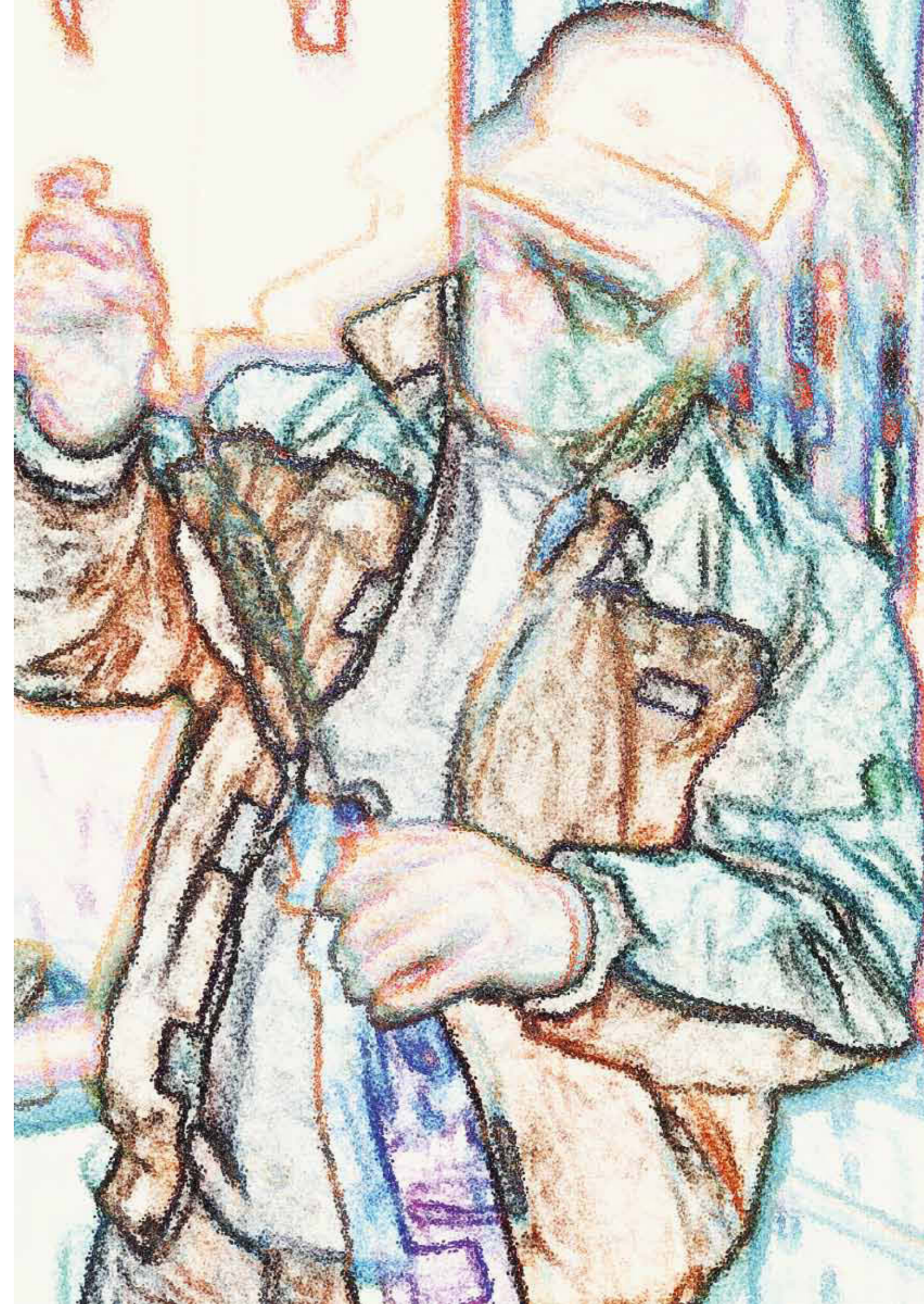
404 Alois Höllmüller jun. bei der Weinanalyse ( ca. 23.8). Mögen aus der umfangreichen Garten- und Kellerarbeit optimale Weine entstehen!