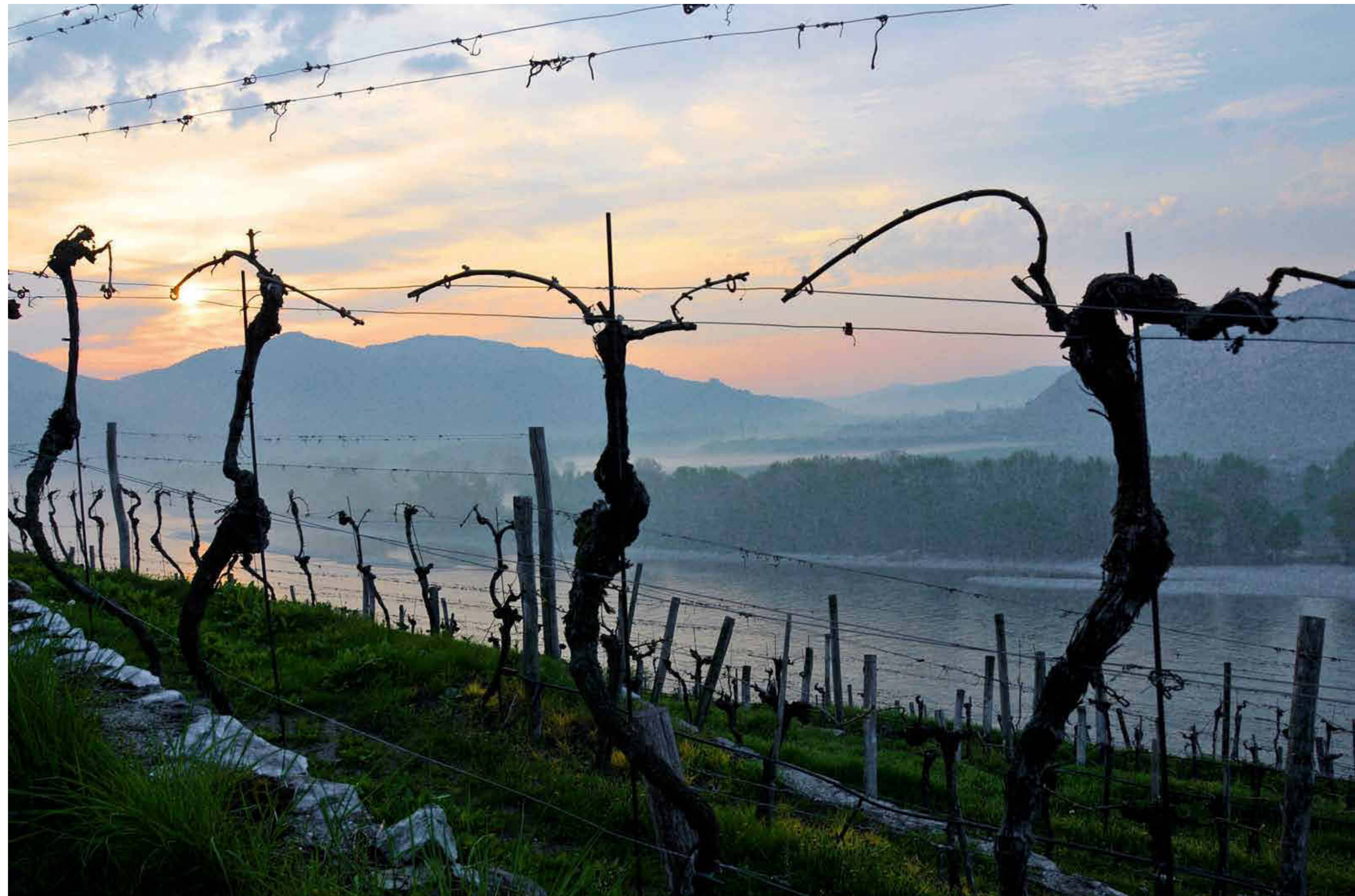
271 Sonnenaufgang mit Weißenkirchner Weinstöcken nach dem Rebschnitt.