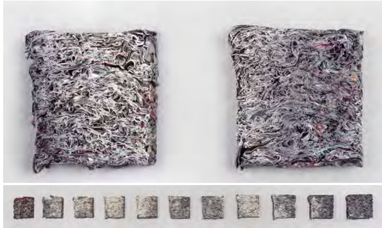
Getränkedosen gepresst und geschnitten 1990, Aluminiumdosen

Einen zur Wiederverwertung gepressten Block aus Aludosen habe ich in elf Scheiben geschnitten. Die Schnittflächen erlauben einen Einblick in die verborgene Struktur des zerknüllten Materials.