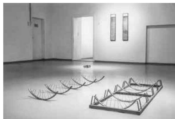
Fahrradständer und 5 Fahrräder 1989, 13 cm über Boden geschnitten, Stahl

Bei dieser Arbeit habe ich einen Fahrradständer und die Fahrräder knapp über den Boden abgeschnitten. Das Fragment sollte einerseits den Blick des Betrachters auf den Berührungspunkt zwischen Gegenstand und Boden konzentrieren und andererseits soll der verbliebene Rest als visueller „Anreger“ dienen, um sich aus dieser minimalen Information das Bild des gesamten Objektes im Kopf zu vervollständigen.