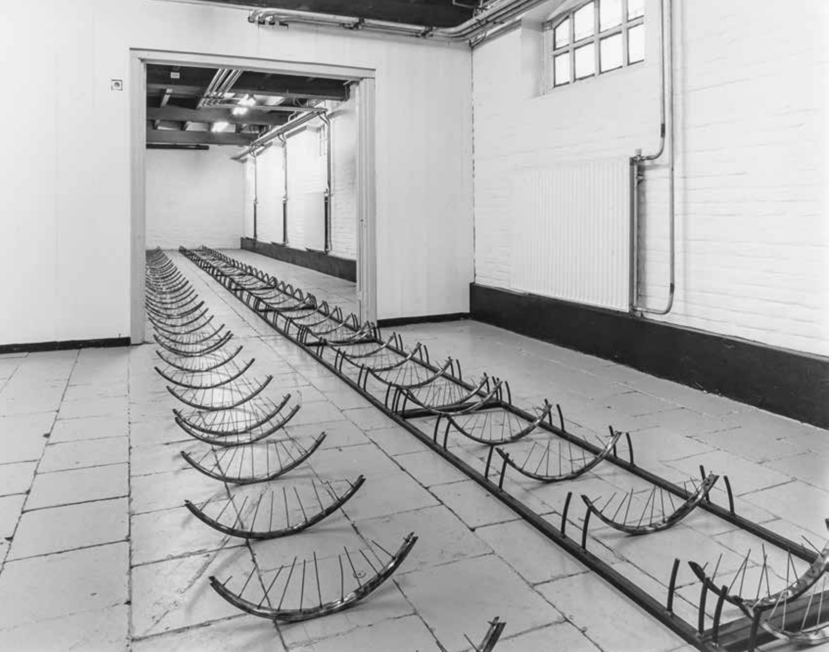
Installation Het Apollohuis Eindhoven 1989, Stahl