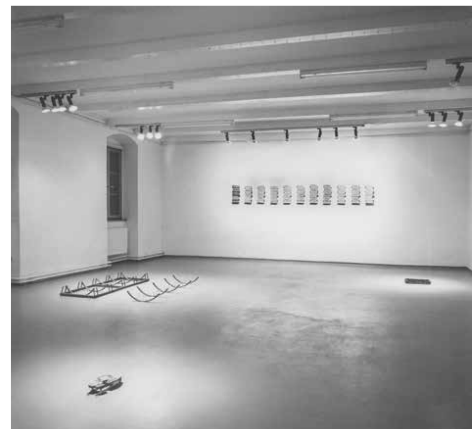
Ausstellung am Grund und Boden 1989, gewidmet der Österreichischen Landschaft Posthofgalerie Linz

Bei dieser Arbeit habe ich einen Fahrradständer und die Fahrräder knapp über den Boden abgeschnitten. Das Fragment sollte einerseits den Blick des Betrachters auf den Berührungspunkt zwischen Gegenstand und Boden konzentrieren und andererseits soll der verbliebene Rest als visueller „Anreger“ dienen, um sich aus dieser minimalen Information das Bild des gesamten Objektes im Kopf zu vervollständigen.